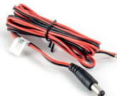
power cable (AK1001)