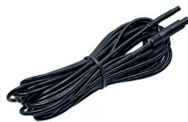
extension cable (AK1013)