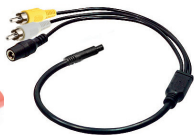
adapter cable (AK1011)